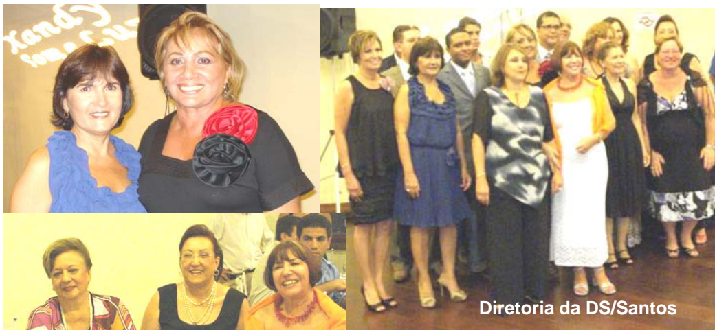
Diretoria da DS/Santos

“A luta pela democracia é que desenvolve o mundo e ela se constrói com e através da comunicação.”